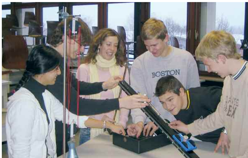
Schülergruppe in Physik