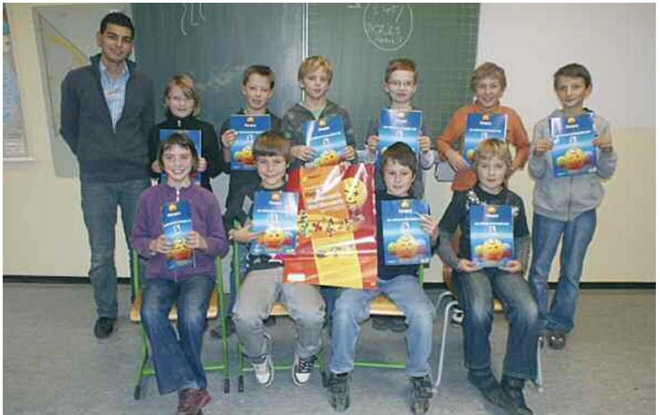
Teilnehmer im Mathematik-Wettbewerb Pangea