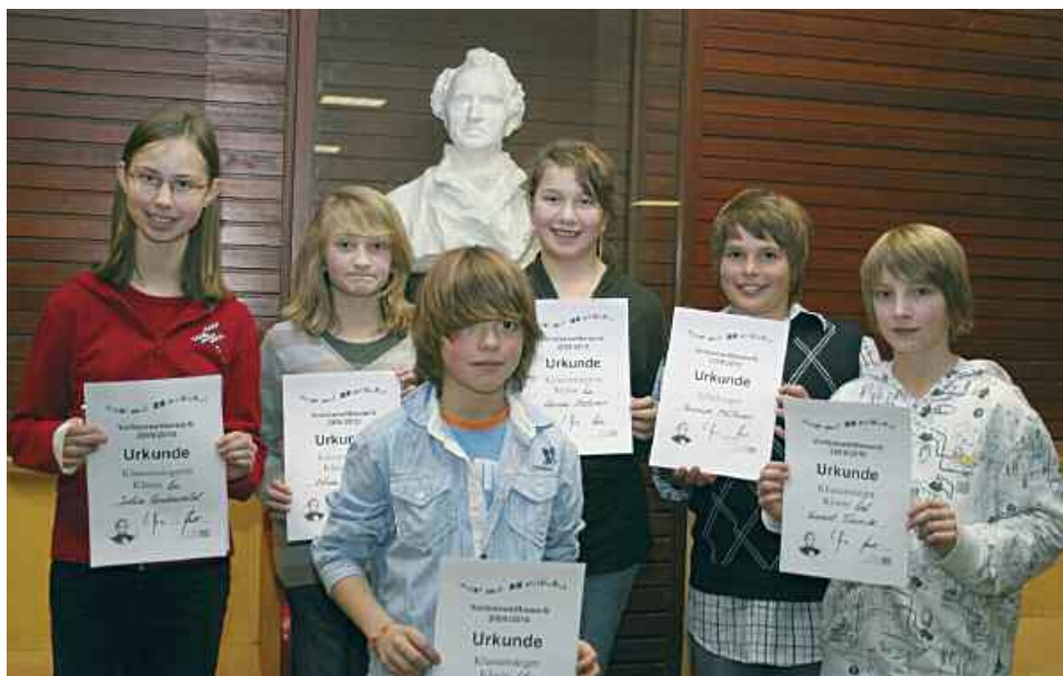
Sieger im Vorlesewettbewerb