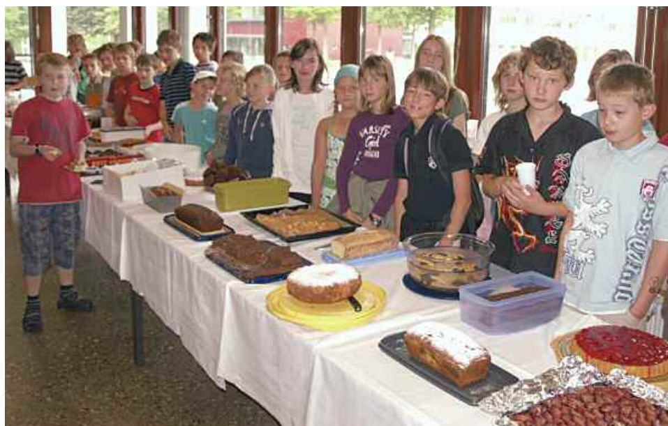
Kuchenbuffet am SMV-Tag